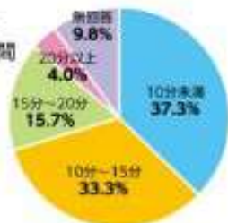
交通手段(複数回答)

徒歩: 31.4% 自転車: 80.4% J R: 3.9% 新幹線: 2.0% 無回答: 9.8%